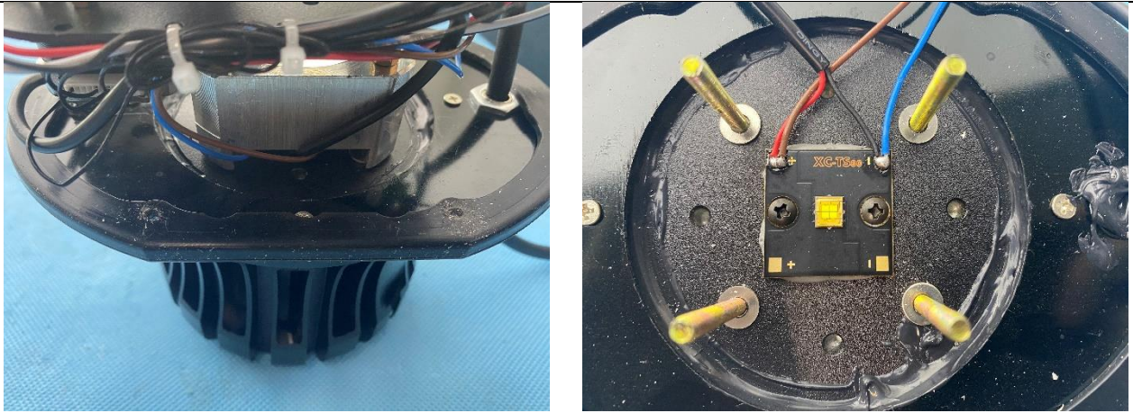
外壳缝隙连接处都采用防水胶圈